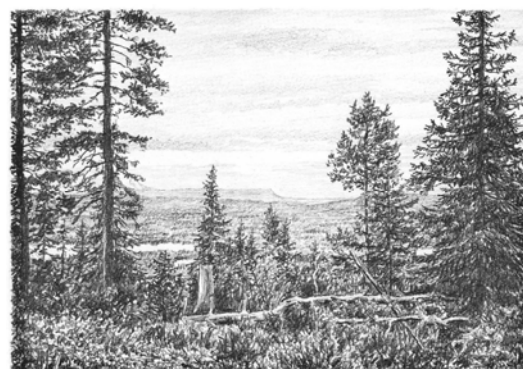
Vy från Tyngeberget

Skogens betydelse för naturupplevelser och friluftsliv tas tillvara. Särskilt i tätortsnära och turistiskt attraktiva områden bör ett skogsbruk bedrivas med inriktning på en tilltalande landskapsbild.