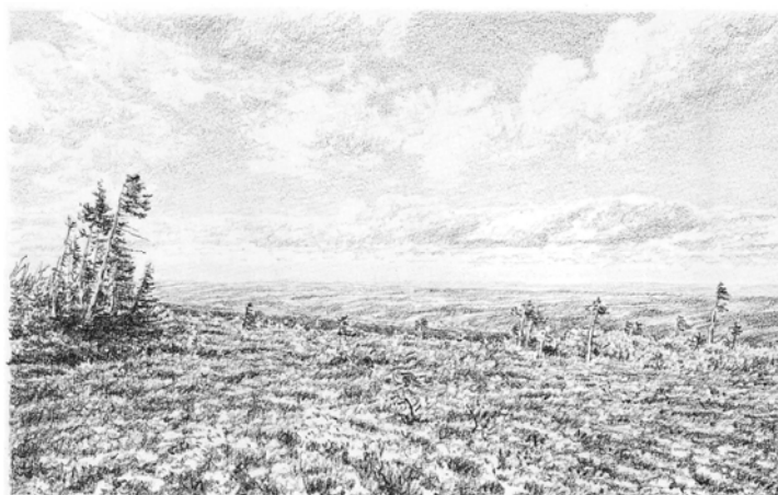
Vy från Hemfjället

Det innebär att tillväxten drivs av dynamiska marknader, en stark välfärdspolitik och en progressiv miljöpolitik. Skrivelsen behandlar också mer generellt vilka förutsättningar och verktyg som behövs för ett effektivt genomförande och för att hållbar utveckling som mål, metod och förhållningssätt skall främjas.