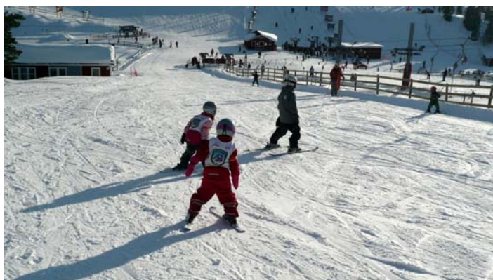
Barnbackarna ger möjlighet till både lek och koncentration

Kommunen har utarbetat en koncis Barn- och ungdomsplan för Malungs kommun , som har antagits av kommunfullmäktige 2007.